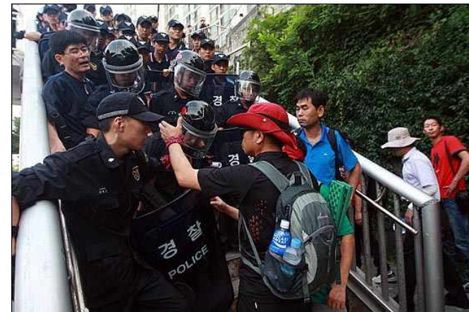
[사진설명] '4차 희망버스' 둘째날인 28일 오전 서울 서대문구 무악청구지벤 아파트 앞에서 희망버스 참가자들이 인왕산으로 올라가기 위해 이동하자, 경찰들이 막고 있다. 9)