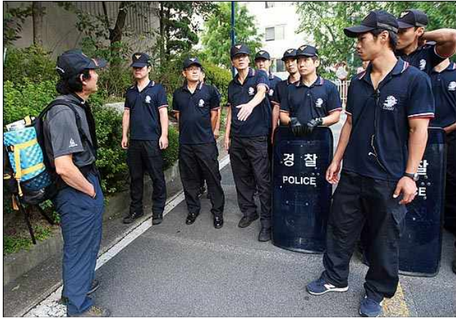
[사진설명] '4차 희망버스' 둘째날인 28일 오전 서울 서대문구 무악청구 아파트 앞에서 경찰들이 인왕산으로 올라가는 등산로를 통제하자, 한 등산객이 항의하고 있다. 10)