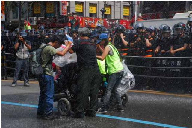
[사진설명] 장애인에게 물대포 난사하자 막아서는 참가자들 -출처 : 합동취재팀 16)

희망버스 참가자들이 마무리 집회를 준비하자, 경찰은 앞 쪽에 장애인 2명과 10여명에게 물대포를 발사했다. 앞 쪽에 장애인이 있었다는 것을 뒤늦게 발견한 경찰은 “장애인은 위협하니 뒤쪽으로 빠지라”는 경고방송을 했다.