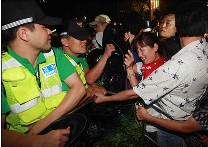
[사진설명] '4차 희망버스' 참가자들이 27일 오후 서울 종로구 광교사거리에서 청계천 아래 쪽 보도로 행진을 벌이다가 인도로 올라 가려고 하자, 경찰들이 이를 막고 있다.2)

8월 27일 경찰은 만민공동회 이후 청계천 초입부터 종로2가에 이르는 청계천 일대를 봉쇄함으로써 집회 장소를 벗어나려는 사람들의 통행을 방해했다. 이에 참가자들은 청계천에서 지상으로 올라오기 위해 계단과 사다리를 이용하는 과정에서 경찰과 충돌함으로써 위험천만한 상황을 겪어야 했다.