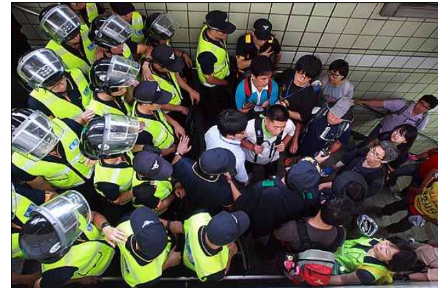
[사진설명] '4차 희망버스' 둘째날인 28일 오전 서울 서대문구 무악재역 출구에서 희망버스 참가자들이 인왕산으로 올라가기 위해 이동하자, 경찰들이 막고 있다. 8)