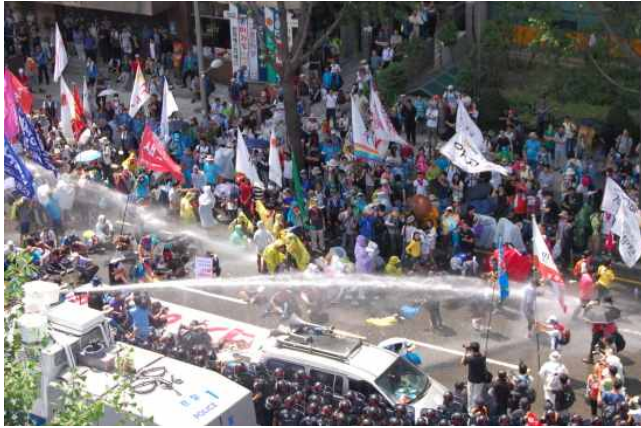
[사진설명] 기자회견 참가자들을 향해 물대포를 직사하고 있다. 15)