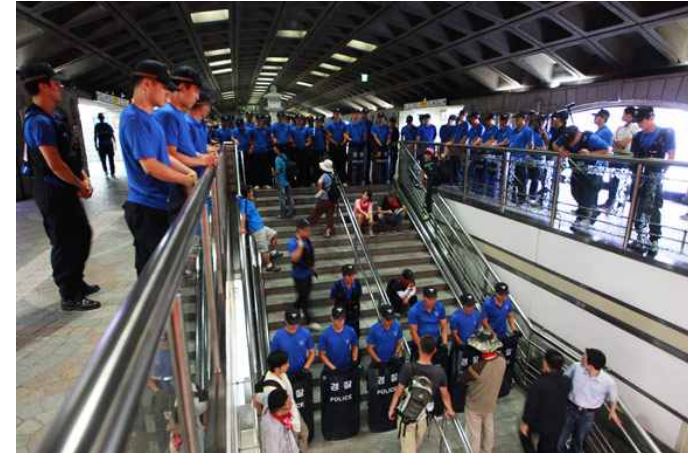
[사진설명] 경복궁역사 안에서 경찰이 배치되어 삼엄한 경비를 썼다. 희망버스 참가자들을 역사 안에서 불법감금 시키고 있다.

8월 28일 4차 희망버스 참가자 3000여명은 청와대 민원실에 ▲조남호 회장 처벌 ▲정리해고 철회 ▲이명박 대통령의 한진중공업 정리해고사태 책임을 촉구하는 내용의 3대 요구안을 청와대에 전달하기 위해 민원접수를 시도했다. 하지만 경찰은 병력 배치해 경복궁역을 완전 봉쇄하고 청와대로 먼저 향하던 참가자 10명을 저지했다. 11) 경찰은 경복궁역 바깥은 물론이고 역사 안까지 경찰력을 배치해 시민들의 통행을 감시하고 희망버스 참가자들의 이동을 제한하고 불법감금을 일삼았다.